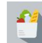
Igiene Alimenti e Nutrizione