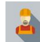
Prevenzione e Sicurezza Ambienti di Lavoro

P4P ha una struttura modulare, con servizi attivabili separatamente, tuttavia assicura sempre la condivisione delle anagrafiche, dello storico delle attività e delle procedure, oltre alla tracciabilità completa delle informazioni.