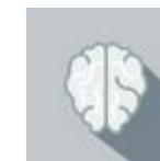
Dipartimento di Salute Mentale