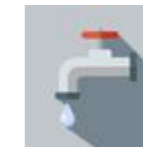
Igiene e Sanità Pubblica